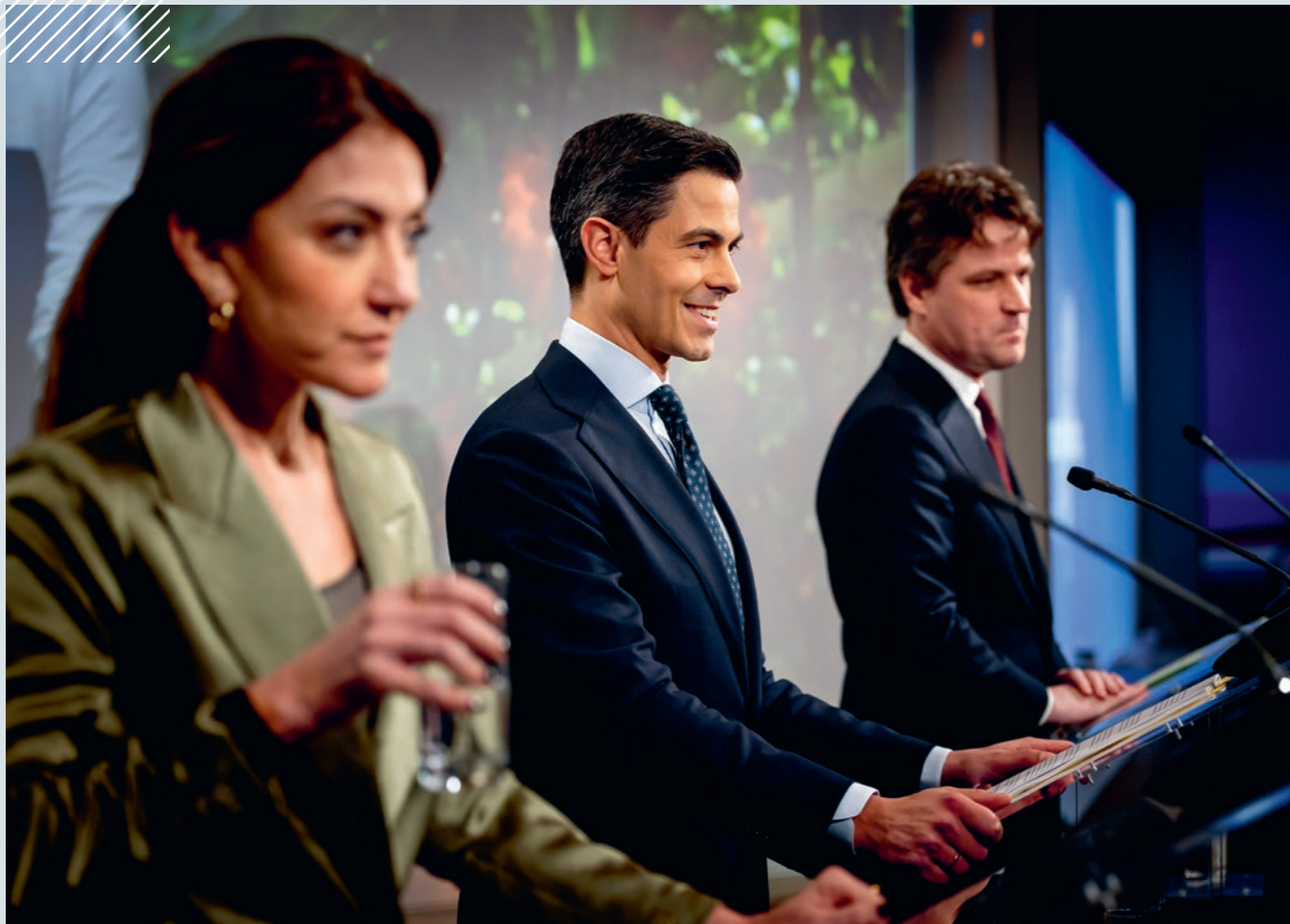
Fractievoorzitters Rob Jetten (D66), Henri Bontenbal (CDA) en Dilan Yesilgöz (VVD) tijdens het presenteren van hun coalitieakkoord in Nieuwspoor.