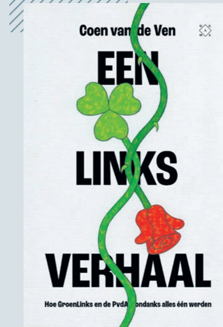
Coen van de Ven, Een links verhaal, Hoe GroenLinks en de PvdA ondanks alles één werden, Das Mag Uitgeverij BV, 2025

Beide culturen kwamen in het congres van afgelopen najaar heel goed naar boven. Waar een flink congresdeel van GroenLinks bestond uit grote groepen joelende meisjes en jongens in alternatieve kleding, was het PvdA-congres toch weer als vanouds bevolkt met would-be bestuurders en oudere gewoontecongresgangers, steggelend over de procedures. Voor mij als PvdA-lid was het duidelijk dat de vibe – om