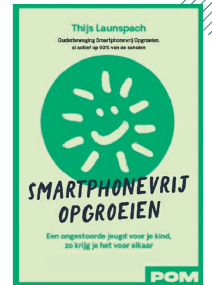
Thijs Launspach, Smartphonevrij opgroeien , Uitgeverij POM, 2025