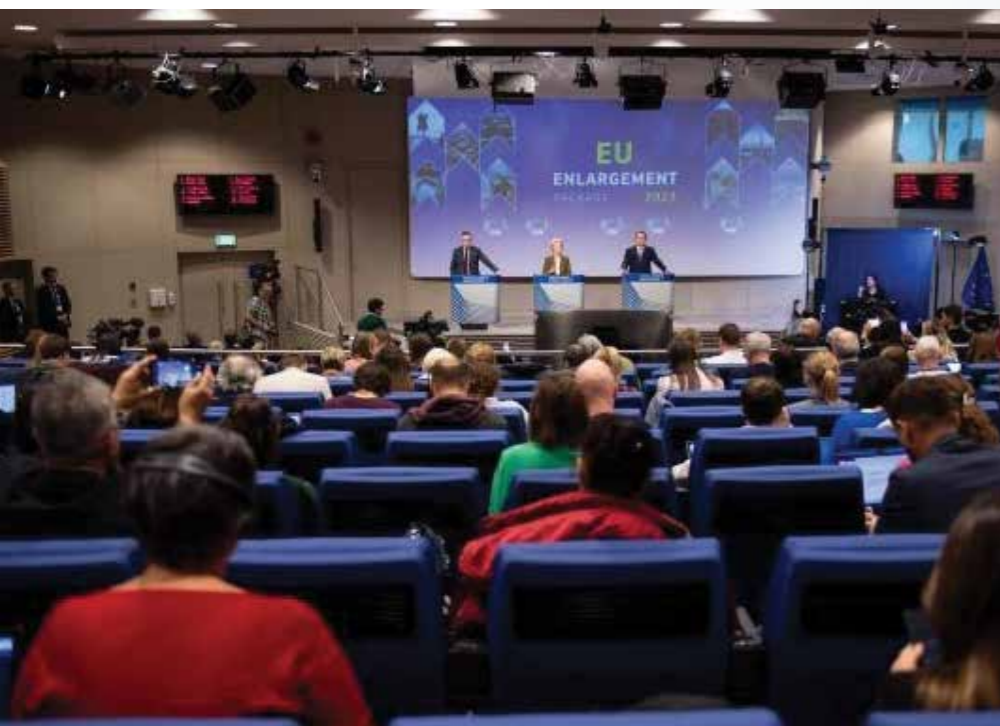
Persconferentie over het Uitbreidingspakket 2023 en het nieuwe groeiplan voor de westelijke Balkan

het echter cruciaal dat een progressief Europa Oekraïense toetreding vooral als een belangrijke kans blijft zien. We moeten Oekraïens lidmaatschap niet benaderen als een liefdadigheidsactie, maar als een solidair project met enorme potentie voor zowel Oekraïne als de EU zelf. Toetreding biedt vele kansen, én vanwege de kwaliteiten van Oekraïne, én als breekijzer in de vele rotte dossiers van falende Europese integratie.