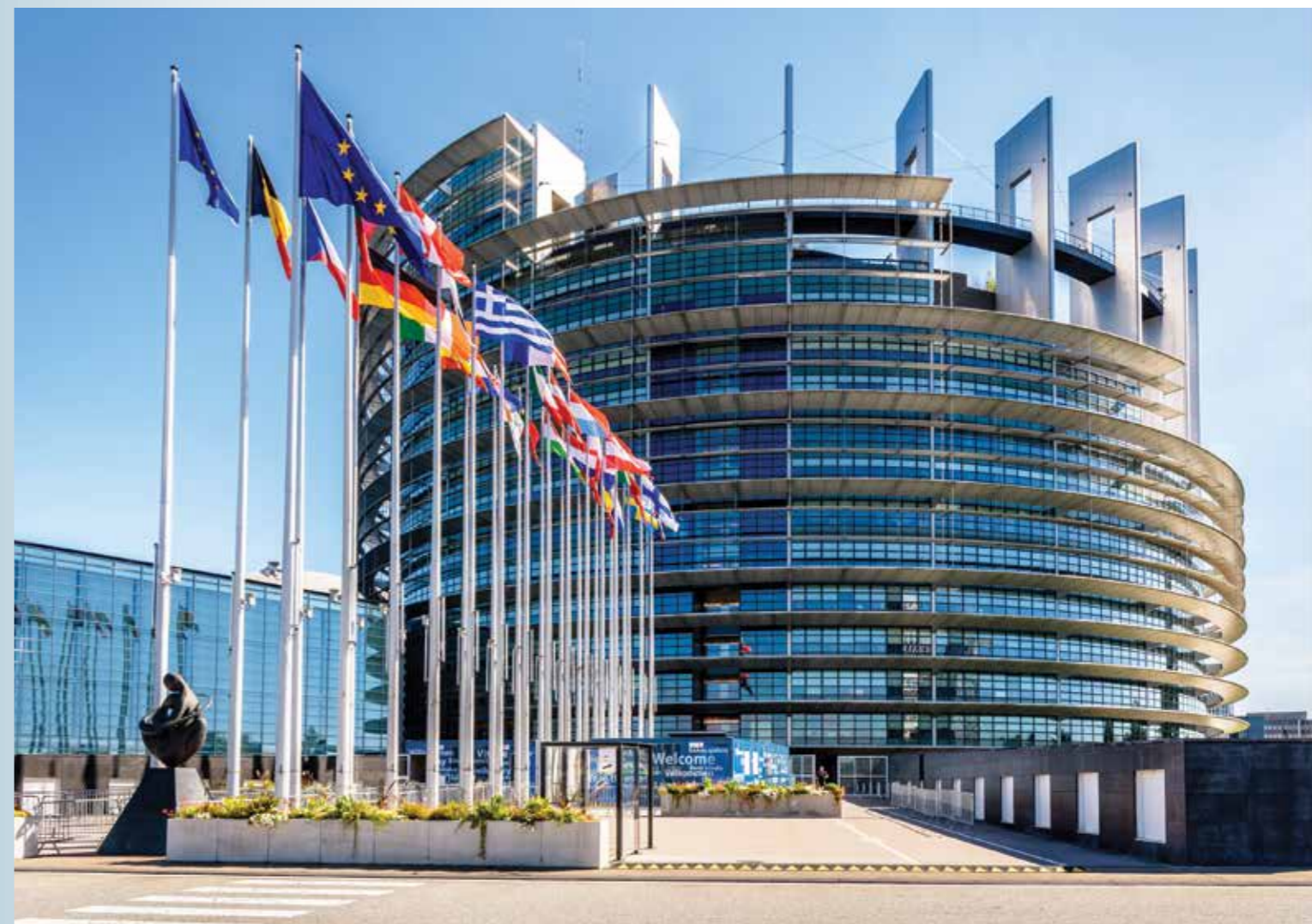
Het Europees Parlement in Straatsburg

Bij de Oekraïense regering leeft de begrijpelijke argwaan dat hervorming slechts een tactiek is om lidmaatschap uit te stellen, en bovendien is ze zeer beducht voor wat ze ziet als ‘tweederangs lidmaatschap’ in het Frans-Duitse voorstel over multi-speed . Toch biedt het huidige momentum een unieke kans om de kolossale institutionele problemen van de EU te bestrijden. Baerbock’s wenslijstje is een goed begin: het inperken van het veto in de Raad, meer Europese samenwerking in buitenlandbeleid, en meer middelen voor de Commissie om de rechtsstaat van lidstaten te beschermen. Aangezien dit soort hervormingen de macht van lidstaten verder inperkt, is het essentieel dat ze gepaard gaan met meer democratische controle. Het ‘democratisch tekort’ van de EU is berucht, maar door de huidige voorstellen lijkt voor het eerst in jaren een doorbraak mogelijk. Allereerst is er het rapport van het Parlement zelf, dat inzet op meer parlementaire controle over het budget, meer invloed over de aanstelling van de Commissie en meer macht ten opzichte van de Raad, waar de nationale regeringen