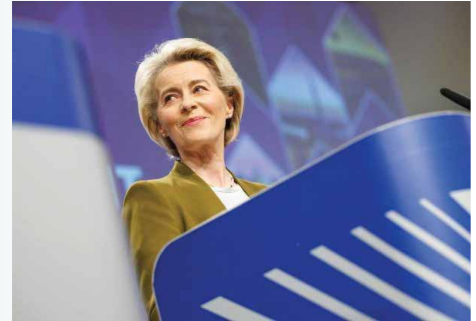
Ursula von der Leyen tijdens de persconferentie over het EU-uitbreidingspakket

Het is de schok van de Russische invasie van Oekraïne die deze omslag heeft veroorzaakt. Net als