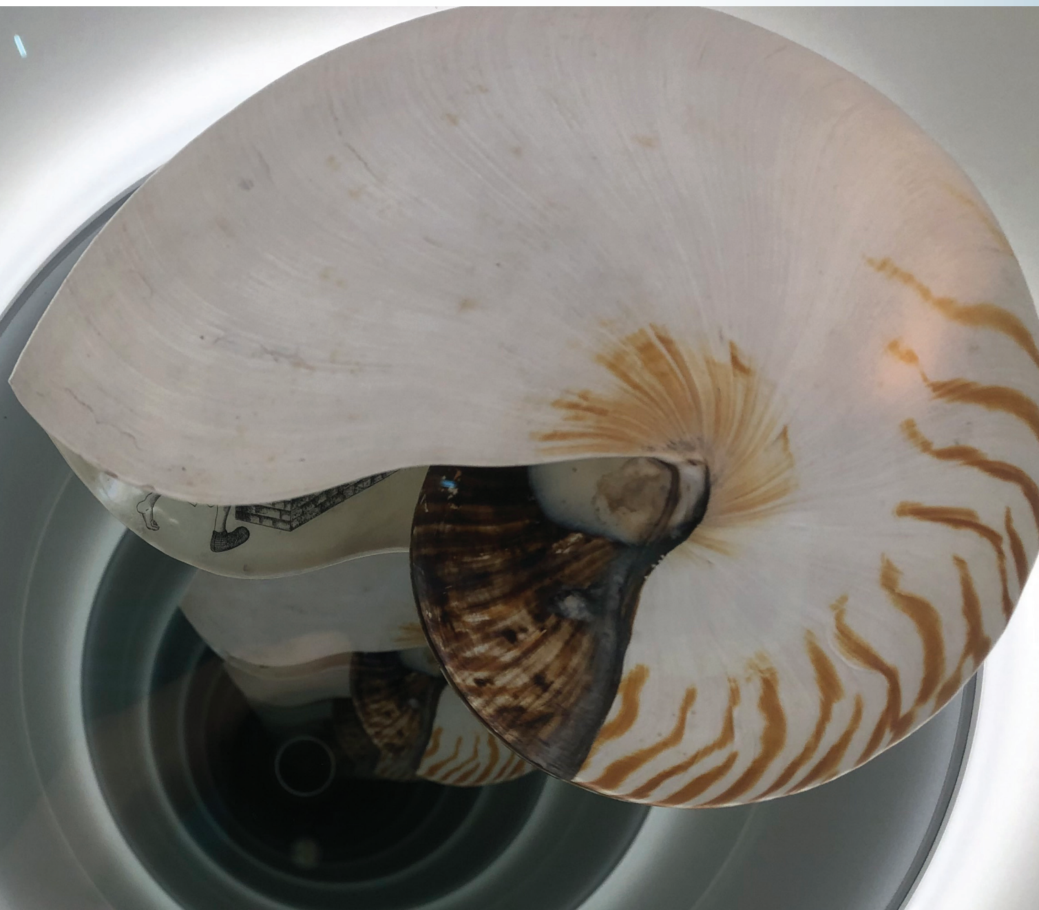
Cyprien Gaillard, Nautilus, gegraveerd met een scene uit Nederlandse spreekwoorden van Pieter Bruegel de Oude.