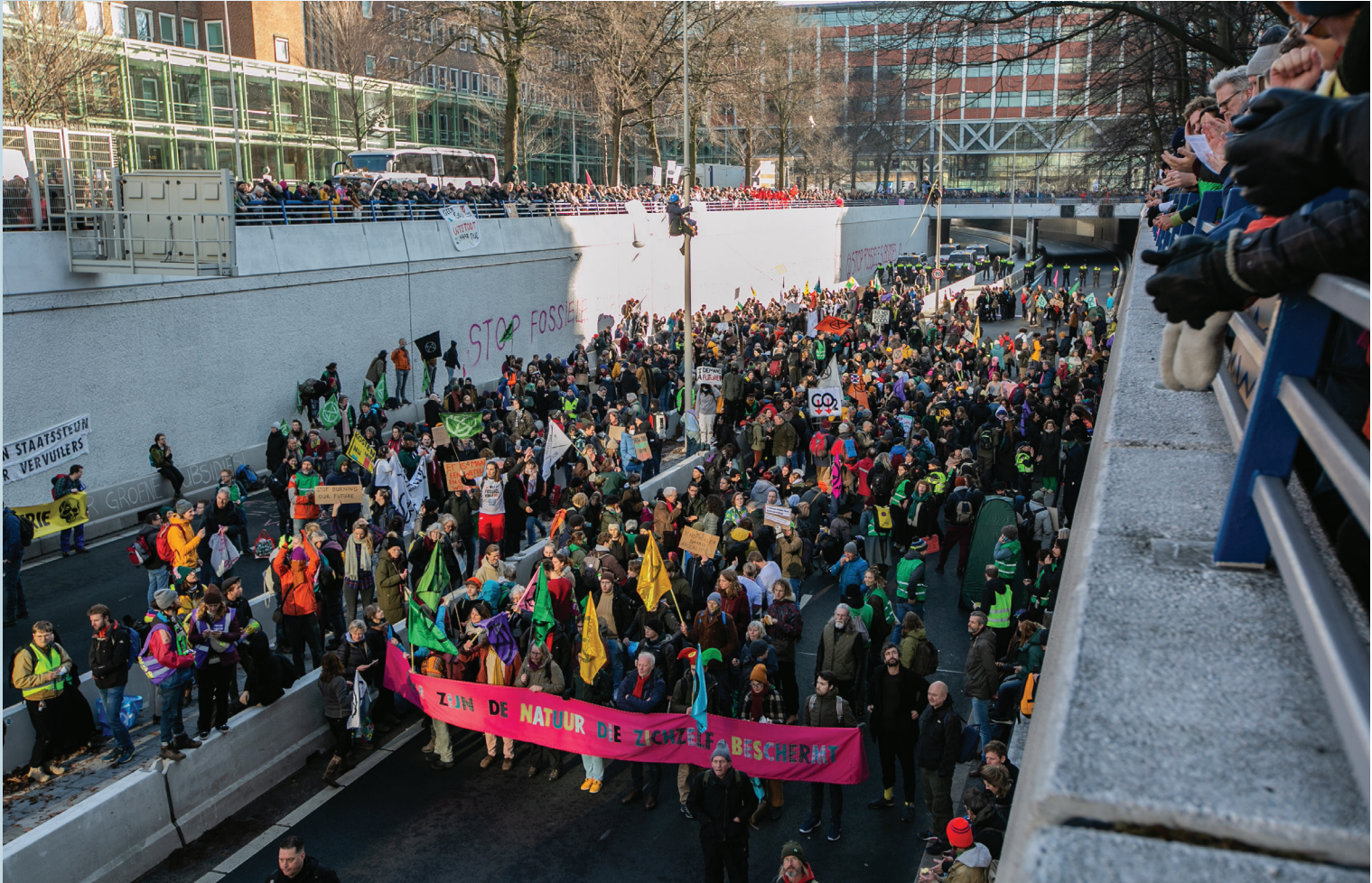
Klimaatprotest op A12, 28 januari 2023 in den Haag