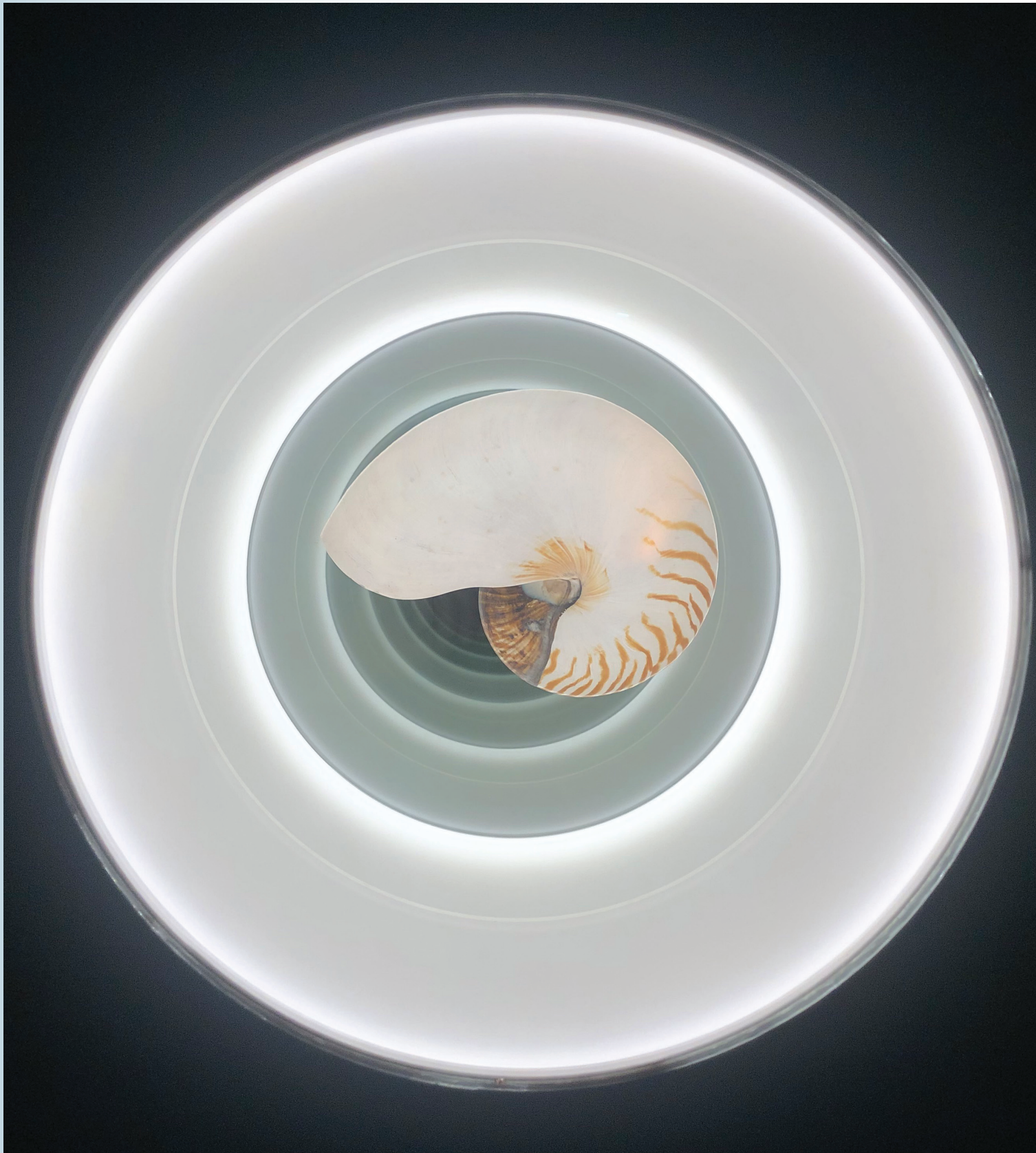
Cyprien Gaillard, Nautilus, gegraveerd met een scene uit Nederlandse spreekwoorden van Pieter Bruegel de Oude.