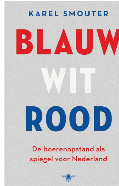
Blauw wit rood – de boerenopstand als spiegel voor Nederland (2023), Karel Smouter, Uitgeverij de Bezige Bij

Ergens zijn beide constateringen binnen de treurig stemmende Nederlandse ontevredenheid ook positief nieuws. Er is vooralsnog geen algemene wijdverbreide fundamentele kloof tussen de stad en het platteland. Stikstof- en landbouwbeleid staan niet bovenaan het zorgenlijstje van veel mensen. De (soms regionaal) gevoelde achterstelling daarentegen wel, terwijl dit niet een onoplosbaar probleem hoeft te zijn. Met meer aandacht voor voorzieningen en