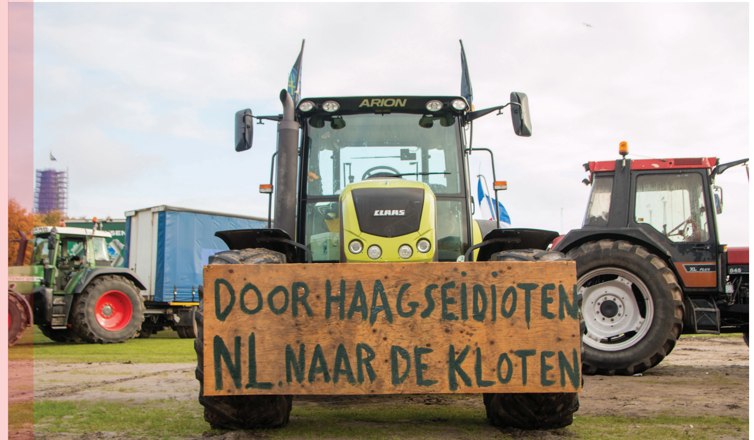
Boerenprotest 16 oktober 2019 in Den Haag

Smouter categoriseert drie hoofdproblemen. Het eerste is de vraag of Nederland een progressieve of conservatieve identiteit heeft. In het boek komen veel Oosterlingen aan het woord die trots zijn op de eigen tradities, folklore, noaberschap . Kortom, trots op de normen en waarden van