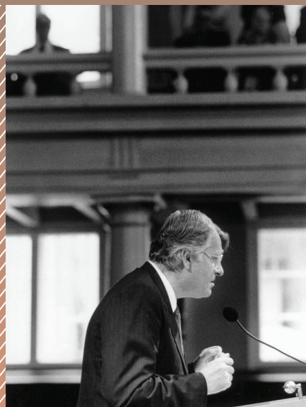
Huub Oosterhuis in de Rode Hoed 1997

Alles zal zwichten en verwaaien wat op het licht niet is geijkt. Taal zal alleen verwoesting zaaien en van ons doen geen daad beklijft. Veelstemmig licht, om aan te horen zolang ons hart nog slagen geeft. Liefste der mensen, eerstgeboren, licht, laatste woord van Hem die leeft.