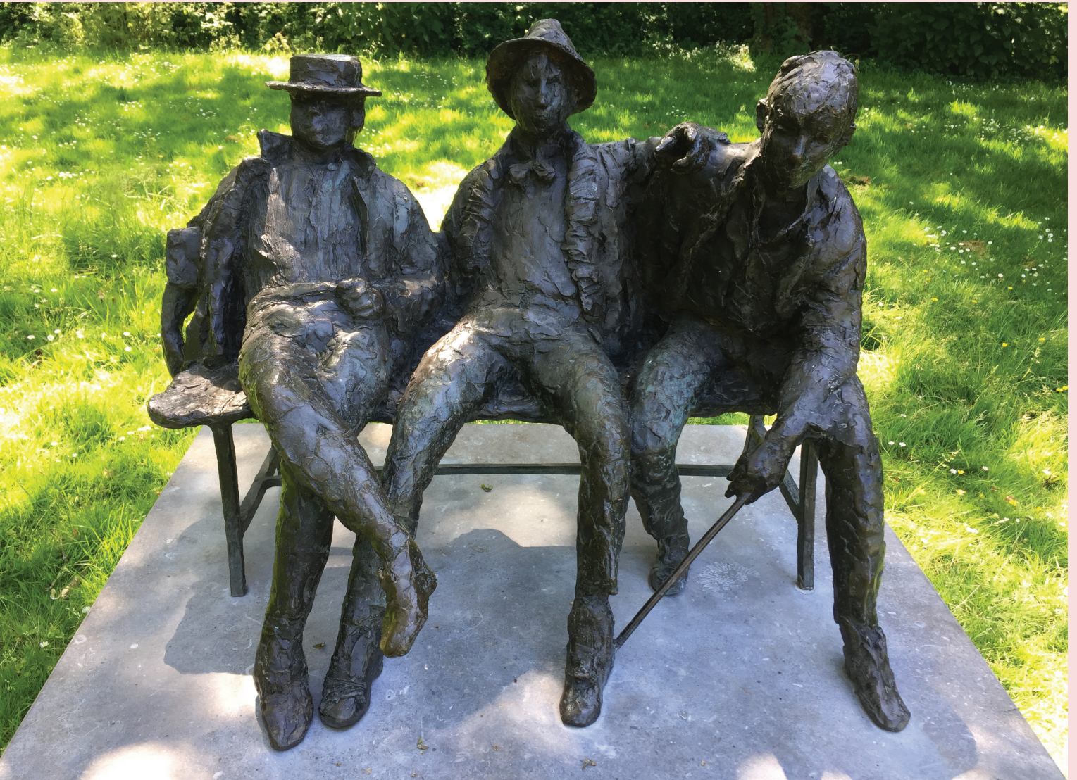
De beelden van de hand van Hans Bayens

De nieuwbouw op de hoek van de Mauritskade en de Pontanusstraat in Amsterdam kijkt uit op molen De Gooyer, die daar al eeuwen staat. Een samenraapsel van oud en nieuw, eind negentiende eeuw was het al niet veel beter. Dat de oude stad en de natuur naar de ratsmodee gaat was een van de vele ergernissen van de schrijver J.H.F. Grönloh alias