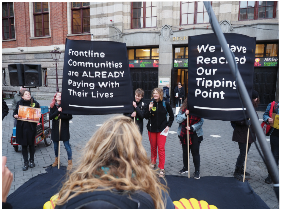
Demonstratie van Fridays for Future , internationale actiegroep van jongeren en scholieren die staken voor het klimaat

Sinds het uitbreken van de coronacrisis is er volop nagedacht over wat dit kan betekenen voor de klimaatcrisis. Bij PvdA Duurzaam, het ledennetwerk van de PvdA dat zich met duurzaamheidsproblematiek bezighoudt, hebben we hier ook bij stilgestaan. Vlak nadat de coronacrisis begon en een jaar later opnieuw. Dit essay is geïnspireerd door diverse bespiegelingen op het klimaat na corona en heeft als doel een wenkend perspectief te bieden voor de sociaaldemocratie.