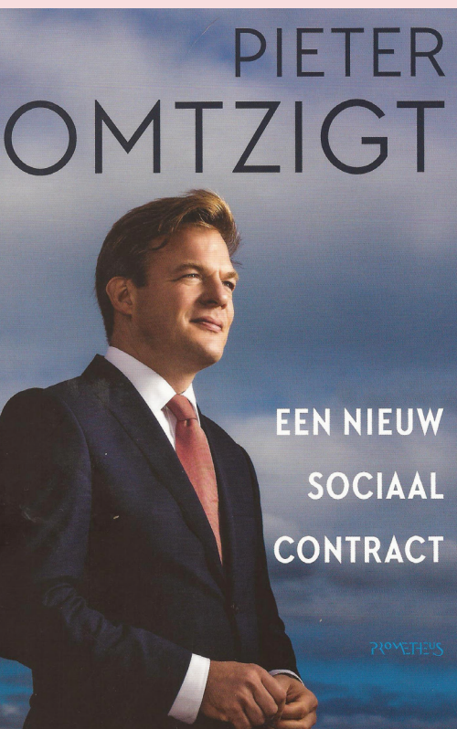
Pieter Omtzigt, Een nieuw sociaal contract (Amsterdam 2021).

ook op het gebied van overheids-falen, meer invloed moeten krijgen. Omtzigt pleit voor meer denktanks en minder communicatieadviseurs. Coalitieakkoorden moeten minder omvattend zijn en parlementariërs moeten vrij en onafhankelijk over dit soort akkoorden kunnen oordelen. Tot slot zou volgens Omtzigt een districtenstelsel de kiezer dichterbij de politicus moeten brengen, aangezien parlementariërs dan echt afhankelijk zijn van de stemmen die ze in de regio ophalen. En dus onafhankelijker staan ten opzichte van hun partij. Wellicht niet het meest concreet, maar wel het fundament onder veel andere