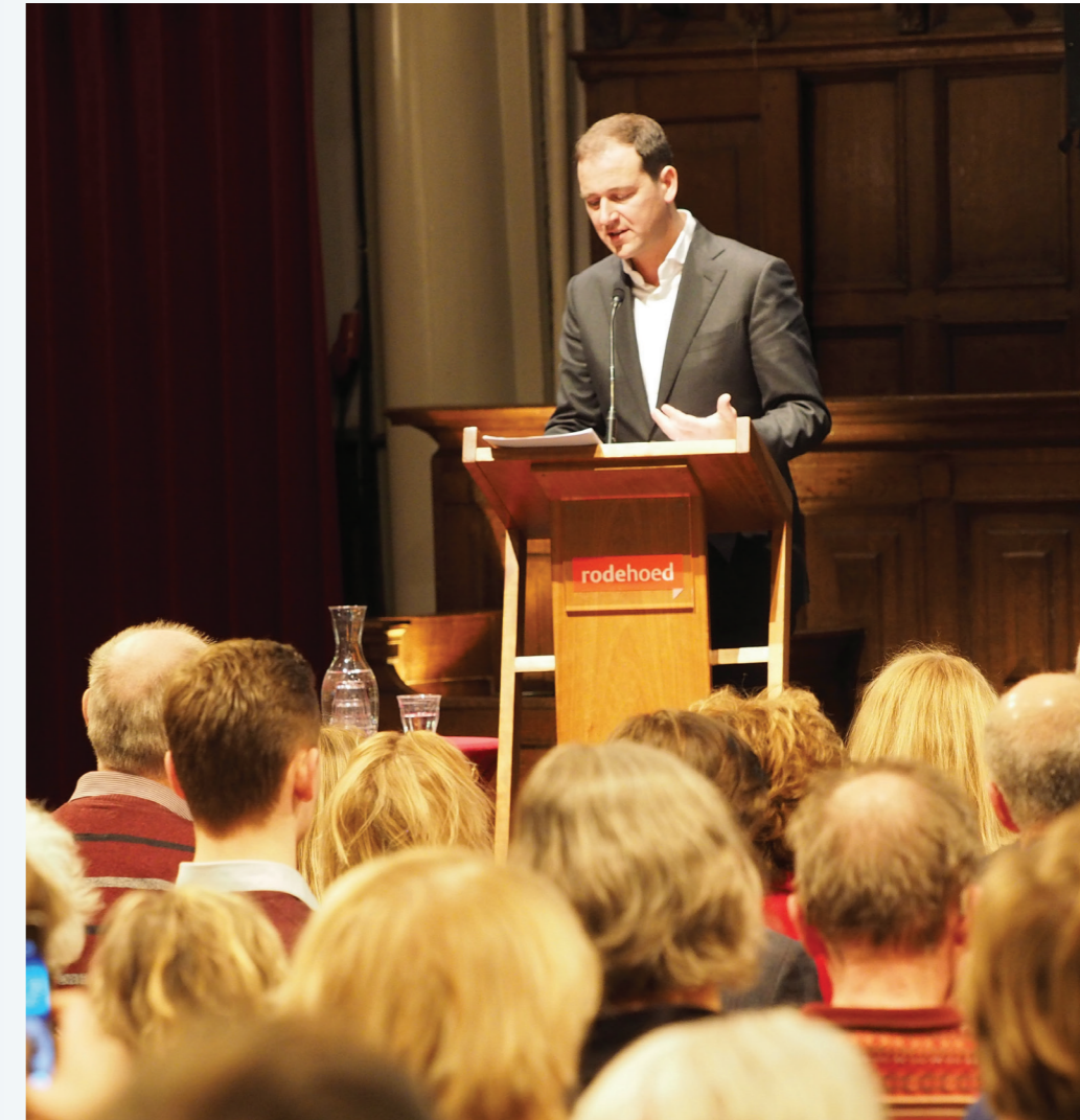
Banning Lezing door Lodewijk Asscher, 21 februari 2018

Nu is angst volgens velen een slechte raadgever, maar ik geloof dat het vage gevoel dat ik wel eens de laatste formele politieke vertegenwoordiger zou kunnen worden van de PvdA in mijn eigen gemeente wel iets losmaakte. Als ik dat licht niet wilde uitdoen, dan moest ik eerst en vooral mijn werk zo goed mogelijk doen. Dus stortte ik me vol overgave op de dossiers, de debatten, de vragen van inwoners en de complexe verbinding tussen die drie grootheden. Dat ging soms goed, soms niet. Maar het ging. Totdat ik het werk na een jaar of twee wel ongeveer in de vingers had en ik me ging afvragen of wat ik deed eigenlijk zou bijdragen aan het doel