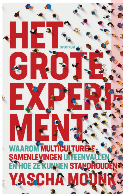
Yascha Mounk, Het grote experiment. Waaorm multiculturele samenlevingen uiteenvallen en hoe ze kunnen standhouden (2022).

Misschien is het dus beter om minder duidelijk te definiëren welke culturele uitingen ons binden, maar eerder in te zetten op gelijkwaardigheid voor alle burgers, ongeacht ras, cultuur of etniciteit. Hiermee betreden we automatisch het mijnenveld van de identity-politics . Mounk onderscheidt in dit debat drie groepen. Als eerste de groep die multiculturele gelijkwaardigheid ontkent, en het liefst de tijd terug zou willen draaien, naar een tijd waarin de natie nog grotendeels bestond uit één homogene