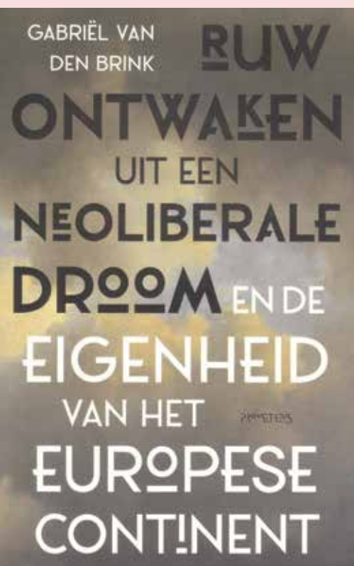
Gabriël van den Brink, Ruw ontwaken uit een neoliberale droom en de eigenheid van het Europese continent (2020).

te geven, start Van den Brink elke paragraaf met een aardige persoonlijke anekdote, door bijvoorbeeld te memoreren hoe een aantal decennia geleden werd gekeken naar autoritair overheidsoptreden, het aanvragen van een uitkering of de integratie van migranten.