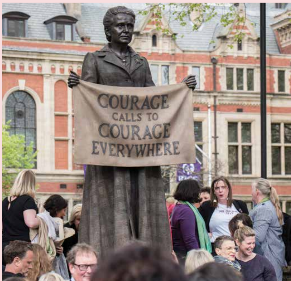
Gillian Wearing CBE, "Millicent Fawcett", 2018. Commissioned by the Mayor of London with 14-18 NOW, Firstsite and INIVA to commemorate the Centenary of the Representation of the People Act 1918, through the Government's national centenary fund.

Nog een keer kijken. Want het is alsof je naar een film uit 1566 zit te kijken. Die historische beeldenstorm, Protestanten die de inventarissen van Katholieke kerken vernielden, is door historici minutieus gereconstrueerd. Er bestaan overzichten van het tijdsverloop, de route van de storm, in kaart gebracht als een echt onweer dat over de Lage Landen raasde. Er zijn ooggetuigenverslagen. Er zijn verhalen