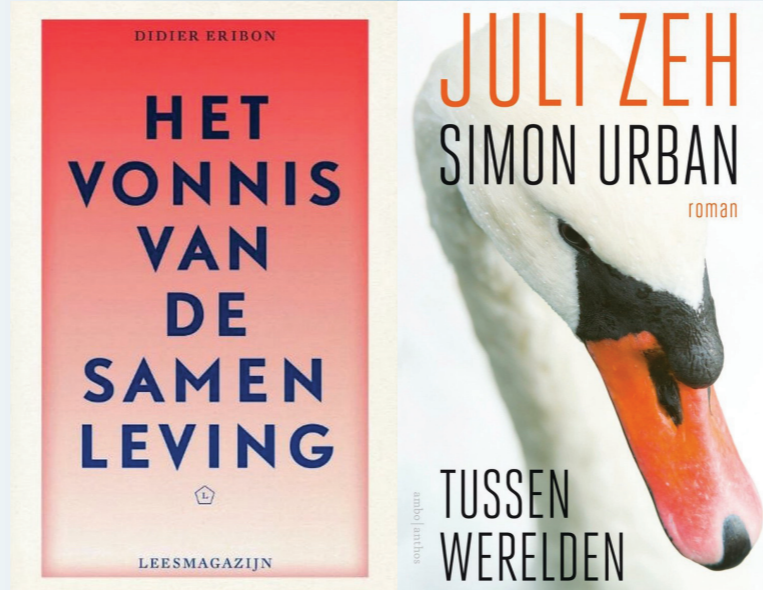
Didier Eribon, Het vonnis van de samenleving , Leesmagazijn, 2023

Een antwoord hierop is wellicht te vinden bij de Franse intellectueel Didier Eribon, die eerder in Terug naar Reims zijn klassenmigratie uiteenzette: als homoseksuele jongen uit een arbeidersgezin brak hij met zijn omgeving nadat hij door scholing en universitaire vorming volkomen vervreemd was geraakt van zijn afkomst. Nu heeft hij met Het vonnis van de samenleving hier een vervolg op geschreven. Hier schrijft hij, in een overigens niet heel toegankelijk boek vol literatuurverwijzingen, over een aantal intrigerende zaken. Zo ziet hij hoe de generatie van zijn ouders als onderdeel van de arbeidsklasse verbitterd raakte. Sociale stijging zat er vaak niet in. Volgeladen met consumptieschulden en een hypotheek, waren ze sterk afhankelijk van en gericht op geld. Het grote doel was een eigen huis, ‘en het vooruitzicht ooit kleine bezitter te worden, maakte hen ontvankelijk voor rechtse propaganda’. Maar die huizen bleken vaak onderdeel te worden van wijken die steeds meer bevolkt werden door immigranten, en waar men naarstig aan wilde ontkomen. De scheidslijnen werden hierbij niet meer klassenlijnen, maar etnische lijnen. ‘Mensen waren vastbesloten om zich los te weken uit een geheel dat werd gedefinieerd als de arbeidsklasse, de minvermogenden, de onbemiddelden. Het was duidelijk de bedoeling, zich te distantiëren van ook maar de gedachte aan een georganiseerde arbeidersbeweging, soms zelfs zich te verwijderen uit de inbedding in een links gemarkeerde politieke ruimte.’