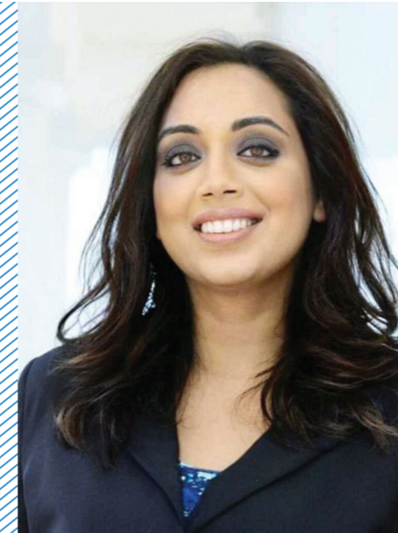
Beeld: Fausia Abdul

In mijn familie- en vriendenapps werd geschokt gereageerd op de verkiezingsuitslag. Wat ons deed schrikken was het grote aantal Nederlanders dat blijkbaar net zo denkt als Geert Wilders. In de media eiste de vraag wie die 2.450.878 mensen zijn die op de PVV hebben gestemd kort na de verkiezingen veel ruimte op.